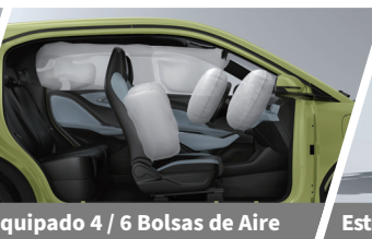
Equipado 4 / 6 Bolsas de Aire