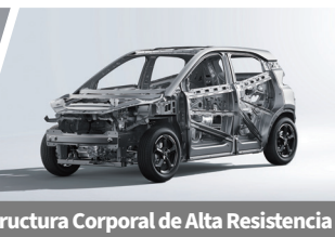
Estructura Corporal de Alta Resistencia

La autonomía (total de kilómetros que puede recorrer un vehículo eléctrico sin hacer paradas para recargar) descrita en la ficha técnica, depende de diferentes factores, incluyendo de manera enunciativa y no limitativa de la capacidad de su batería, el uso que se haga del motor, las características del vehículo, el estilo de conducción, condiciones de manejo, los hábitos de manejo del usuario, las condiciones del camino, así como el peso y tamaño del vehículo, su potencia, el tipo de carretera, el clima, la velocidad, del propio conductor, entre otros.