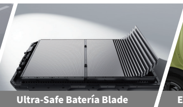
Ultra-Safe Batería Blade